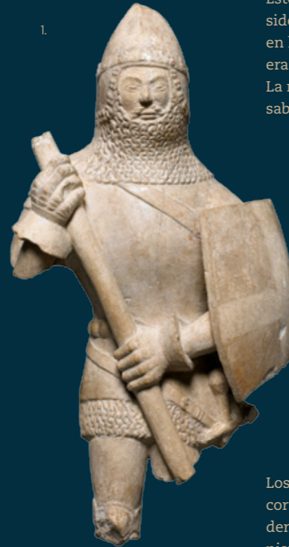
1. Estatuilla de un caballero, 1375-1425.

Los monarcas medievales gobernaban ejerciendo un poder absoluto. Aunque los reyes y las reinas podían ser elegidos, lo más habitual era que el derecho a reinar se heredara. Estos reyes también ejercían un rol espiritual y se les consideraba escogidos por Dios. La ceremonia de coronación, en la que eran coronados y ungidos con los santos óleos, era una manifestación de este designio divino. La realeza necesitaba mantener la autoridad y recompensaba generosamente a la nobleza por su lealtad.